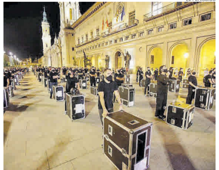
►► Protesta realizada recientemente por el sector en Zaragoza.

En efecto, las citadas subvenciones están destinadas a la realización de proyectos culturales